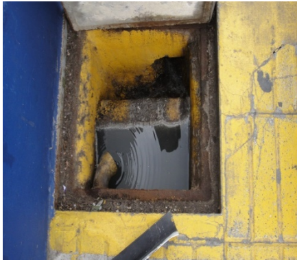
Foto 1. Caja de inspección de agua residual